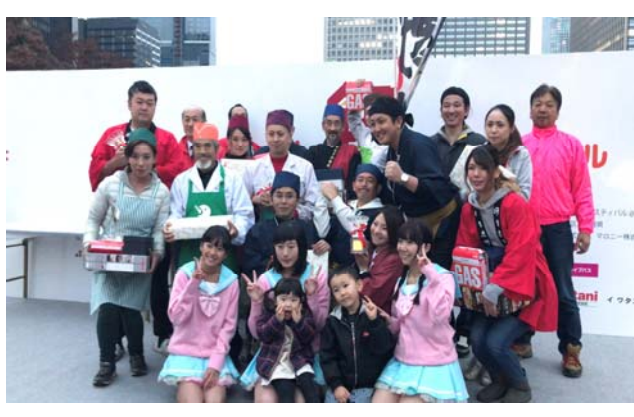
写真はおお喜びの皆さん

スタッフの皆さんは当赤坂会館に宿泊、材料の仕込みなど朝早くから夜遅くまで準備に大わらわ、ちなみに2位は千葉県の「白ハマグリ鍋、3位は新潟鴨ネギ鍋でした。