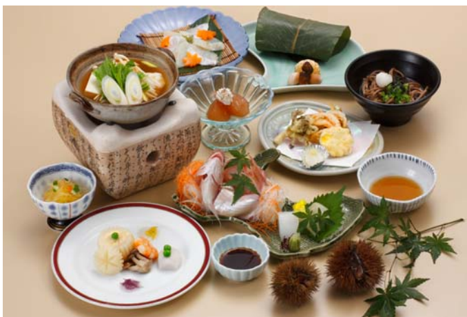
写真は7200円のイメージです、コースは予約制となっております。

環境省では2050年、21世紀のあるべき社会の姿を、真に持続可能な環境共生型の社会、いわば環境・生命文明社会と見定め、それを実現するための戦略を描き、展開することを政策の軸に据えています。