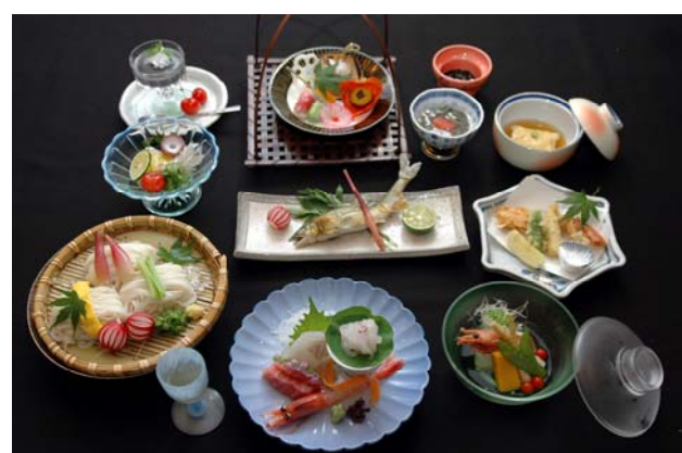
写真は7200円のイメージです、コースは予約制となっております。

雪プラン6200円 月プラン7200円 花プラン8200円 (税金8%、サービス料10%が含まれております)