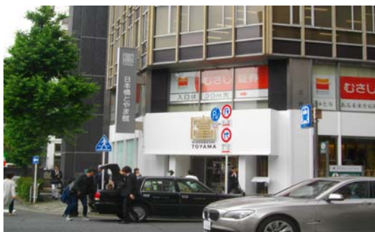
写真は日本橋とやま館

一方江戸東京博物館では、8月28日まで「大妖怪展」が開催、平安～鎌倉時代の国宝「辟邪絵」をはじめ、現存する最古の「百鬼夜行絵巻」として名高い真珠庵本（重要文化財）などの中世絵巻や、伊藤若冲の「付喪神図」、葛飾北斎「狐狸図」など縄文時代の土偶から現代まで4000年の名品を堪能できます。また、各地の花火のほか、夕涼みを兼ね「日本橋とやま館」で富山の銘酒を試飲したり、六本木「ラ・シャンデル」居酒屋「ル・クール」でシャンパンを楽しむのもいかがでしょうか。