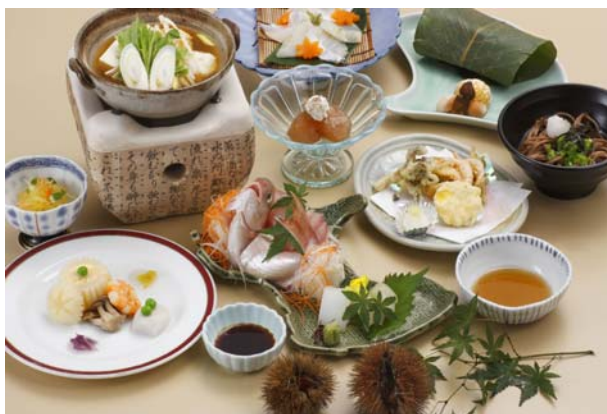
写真は7200円のイメージです、コースは予約制となっております。

雪プラン6200円 月プラン7200円 花プラン8200円 (税金8%、サービス料10%が含まれております)