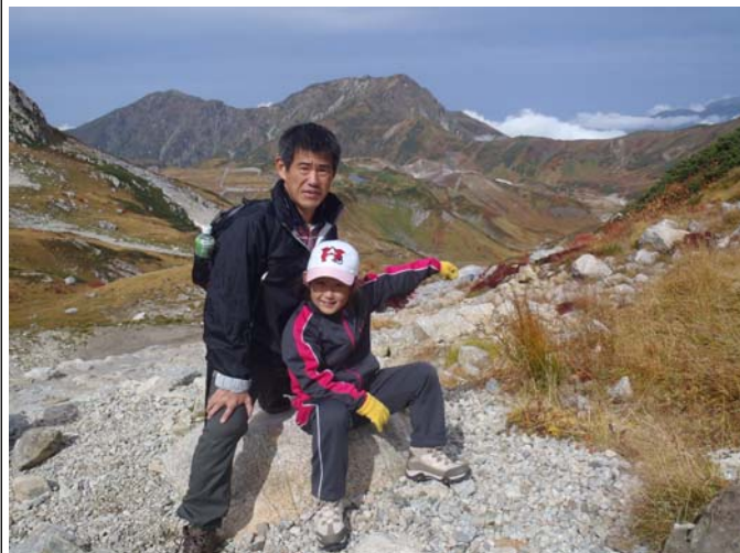
写真は娘と雄山に登った時のスナップ

また、赤坂会館を利用され、富山の味覚に魅了された方には、是非、北陸新幹線で富山まで足を運び、現地で直接、富山の食、自然、文化に触れていただければと思います。