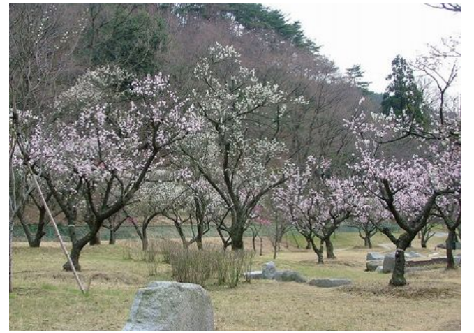
写真は栃木梅林公園

関東近郊の梅まつりは、白梅を中心に300本余、梅の名所として江戸時代から庶民に親しまれ、最近では40万人の人達が訪れる湯島天神では、2月8日～3月8日まで文京梅まつりが開催される。また、世田谷羽根木公園では2月7日～3月1日まで梅まつりが。小石川後楽園では、約100本の梅が香る名所である。一方熱海では、3月6日まで第72回梅園梅まつりが開かれ、59品種472本の梅が咲き誇ります。期間中は甘酒の無料サービスやミス熱海との記念撮影会も行われる。日本三名園の水戸偕楽園では、3月31日まで梅まつりが開かれ、約100種類、3,000本の梅が咲く様子は圧巻です。その他、埼玉越生梅林は3月下旬まで2ヘクタール1,000本の梅が楽しめる。栃木梅林公園は、白梅が140本、紅梅が80本、唐沢山県立自然公園のふもとにありバリアフリーでお年寄りなどにも優しい。