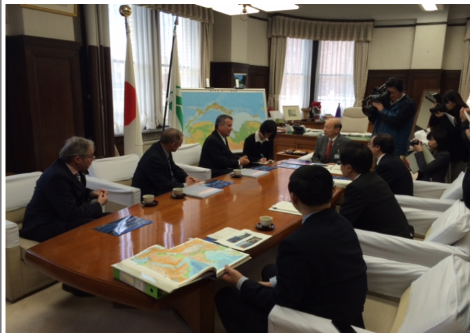
写真は富山県視察のために訪れた美しい湾協会理事長と石井富山県知事

最後に、ここ数年の間に富山県と深く関わられたことはとても嬉しいことであり、これもひとえにチャンスを下さった皆様のお陰です。心より感謝申し上げます。