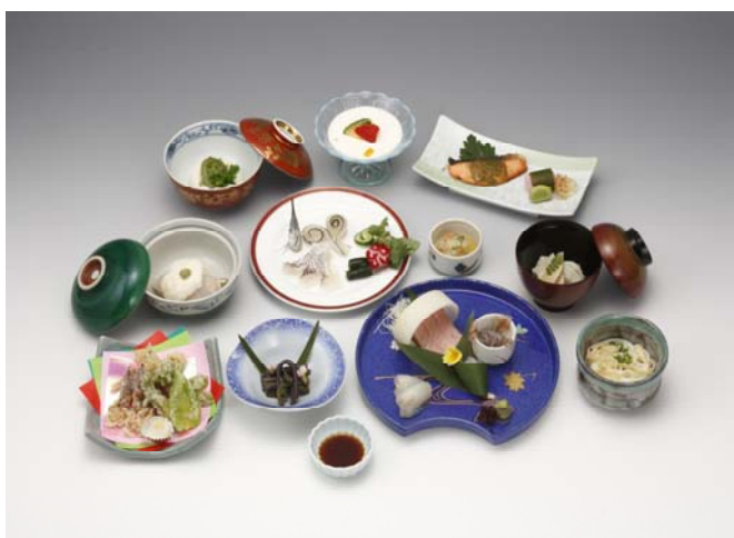
写真は6200円のイメージです、コースは予約制となっております。

和会席 お献立 先付け 甘海老漬 お造り 平目 昆布締 煮物 絹川豆腐 焼物 鱈野菜巻焼 酒肴 鯛冷しゃぶ 揚げ物 白エビ揚げ 酢の物 新湊紅ズワイ蟹 食事 五箇山蕎麦 水菓子 こちらは雪プランの例となっております。なお、仕入れの都合により内容が変わります。詳しくはご利用の際お気軽にお問い合わせください。