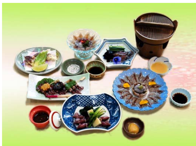
写真は6200円のイメージです、コースは予約制となっております。

和会席 お献立 先付け 鱈南蛮漬 お造り ホタルイカ 昆布締 煮物 鱈雲鰯掛 焼物 鱈田楽焼 温物 ホタルイカしゃぶ 揚げ物 白エビ揚げ 酢の物 新湊紅ズワイ蟹 食事 五箇山蕎麦 水菓子 こちらは雪プランの例となっております。なお、仕入れの都合により内容が変わります。詳しくはご利用の際お気軽にお問い合わせください。