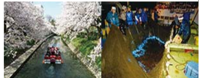
写真は松川べりの桜とほたるいか洋上観光