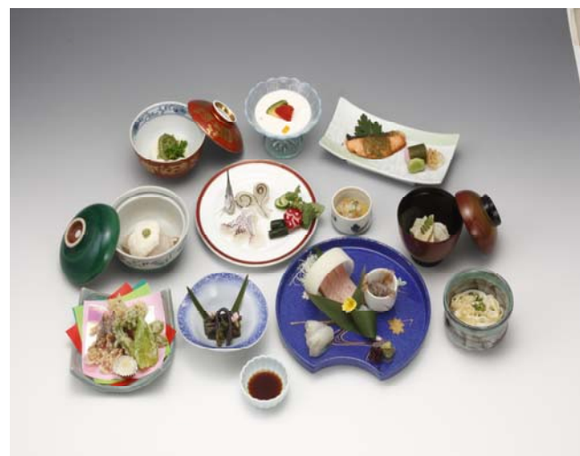
写真は6千円のイメージです、コースは予約制となっております。

Aプラン6千円 Bプラン7千円 Cプラン8千円 (税金5%、サービス料10%が含まれております)