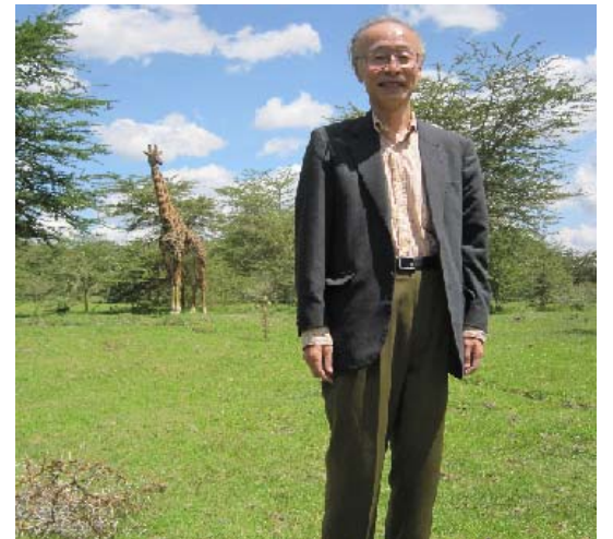
写真はケニア国連会議でナイガシャ湖畔のキリンを背景に

冬の富山の恵みが今年も赤坂会館にやってきた。鰯もよし蟹もよし。かぶら寿司もよし。日本に、そして富山に生まれ育ったことに感謝する季節である。