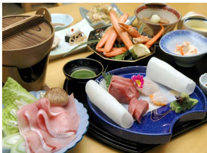
写真は6千円のイメージです、コースは予約制となっております。

和会席 お献立 先付け 蕪寿司 お造り 鰯目地鮪 深層水あわび 煮物 鰯大根 焼物 甘鯛朴葉焼き 温物 鰯しゃぶ 揚げ物 白エビ揚げ 酢の物 新湊紅ずわい蟹 食事 氷見うどん 水菓子 こちらはAプランの例となっております。 なお、仕入れの都合により内容が変わります。 詳しくはご利用の際お気軽にお問い合わせください。