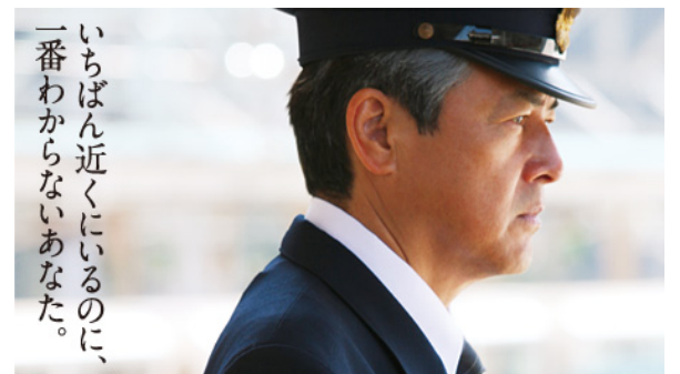
いちばん近くにいるのに、一番わからないあなた。

人生は鉄道に乗った長い旅ー人生を鉄道になぞらえて描く名画。人生の節目に直面し、これからの生き方を模索する一組の夫婦が主人公です。雄大な北アルプスを望む富山の美しい田園風景を舞台に、歳を重ねてこそ感じる迷いや焦り、喜びと幸せ、そしてかけがえのない絆を描きます。これからの人生をよりよく、輝いて生きていこうとする大人たちへの勇気と希望を与えてくれる感動作が誕生しました。