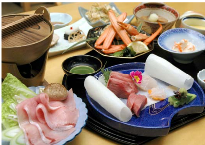
写真は6千円のイメージです、コースは予約制となっております。

Aプラン6千円 Bプラン7千円 Cプラン8千円 (税金5%、サービス料10%が含まれております)