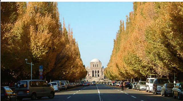
写真は紅葉の神宮外苑イチョウ並木

ビジネスに、ご家族や友人、グループでの思い出づくりに、今年の秋は赤坂会館を拠点に楽しい旅をお過ごしになりませんか。