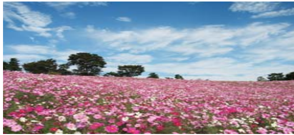
写真は国営昭和記念公園のコスモス

10月30日まで旧古川庭園バラフェスティバル 10月30日まで日比谷ガーデニングショー 10月30日ハロウィンキッズパレード ララポート豊洲 10月27～11月3日神田古本まつり 10月27～29日電気自動車展 ビックサイト 10月28～30日住まいのリフォーム展 ビックサイト 11月3日まで国営昭和記念公園コスモス祭 11月1～23日東京都観光菊花展日比谷公園 11月2～6日東京ラーメンショウ駒澤オリンピック公園 11月3日 山梨ヌーボー祭 日比谷公園 11月3～6日 2011楽器フェア パシフィコ横浜 11月5日まで靖国神社奉納菊花展 11月9～11月13日神代植物公園菊花大会 11月5日美空ひばりメモリアルコンサート東京ドーム 11月15日まで浅草菊花展 11月23日まで明治神宮菊花展