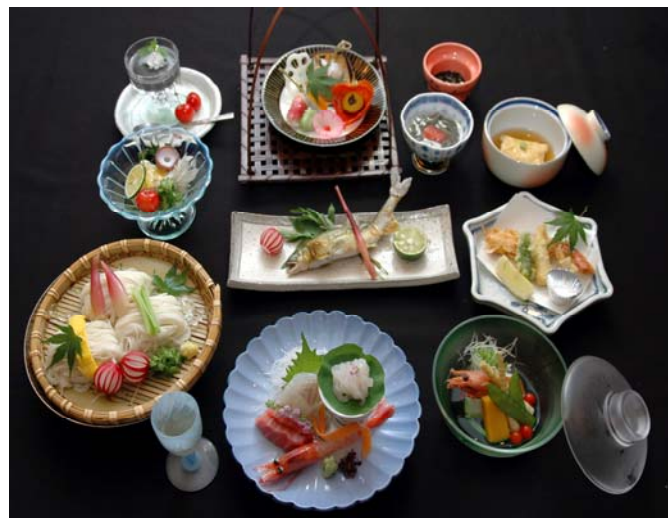
写真は6千円のイメージです、コースは予約制となっております。

おわらの歌詞にはこのように男女の間で微妙に揺れる心の内を詠んだものが結構多い。むしろこの季節の祭りには豊年万作を祈る歌が