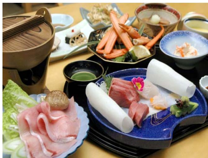
写真は6千円のイメージです、コースは予約制となっております。

*お申込、詳しいお問い合わせは富山県庁生協旅行センター(富山県庁1F) 電話 076-441-1152 FAX076-441-1153