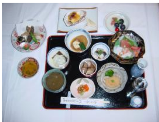
写真は会席料理のイメージです、コースは予約制となっております。

雪 5,775円 月 6,930円 花 8,085円 (税金5%、サービス料10%が含まれております)