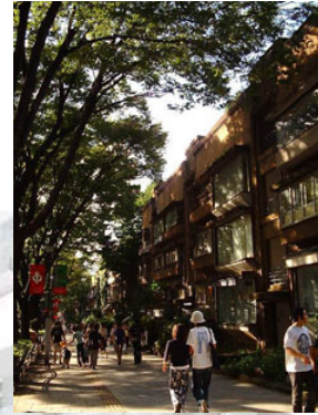
写真右上、旧同潤会 アパート。その他の写 真は建築中の表参道 ヒルズです。