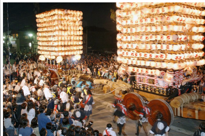
写真は曳山のぶつかり合いで祭りは最高潮に