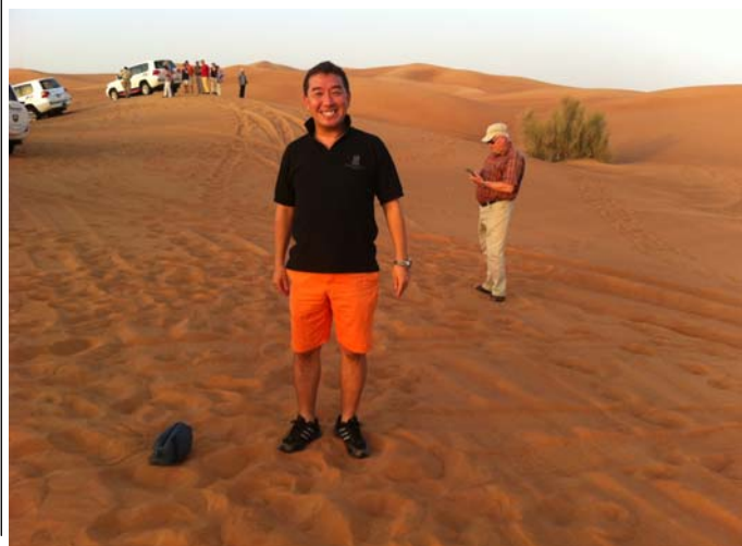
写真はサハラ砂漠でのスナップ

そして、節水バルブの在庫が倉庫にあったので、それをお客様の事業所に無償で付けて差し上げよう。使ってもらって水の使用量を削減できれば買ってもらえるのではと思い、倉庫に置いていたバルブを全部車に積んで、それをお客様先に付けて行くという作業を必死でやり続けました。結果は大成功。使用して効果を実感した方が次々に節水バルブを購入してくださるようになったのです。経営ってというのは、社員だけでなく代表者も明るく元気なのが一番だと思っています。健康であれば、絶対毎日働けるわけだから、しっかり頑張っていればこの苦境を絶対に脱出できる。僕は様々なご縁をいただいて今ここまで来られています。出会って人に助けられているので、他人の利益から自分の利益を出すという精神で、他人の利があってこそ自分の利だと考えます。困っている人が居れば自分のできる範囲で役に立てば、必ずどこかで返ってくると思うのです。資源を大切にしてお手伝い、地球にやさしく自分も動いていたら報われることもあったりするんじゃないかな。まずは自分が動いて、誰か困っている人の為になることを、これからもやっていこうと思っています。