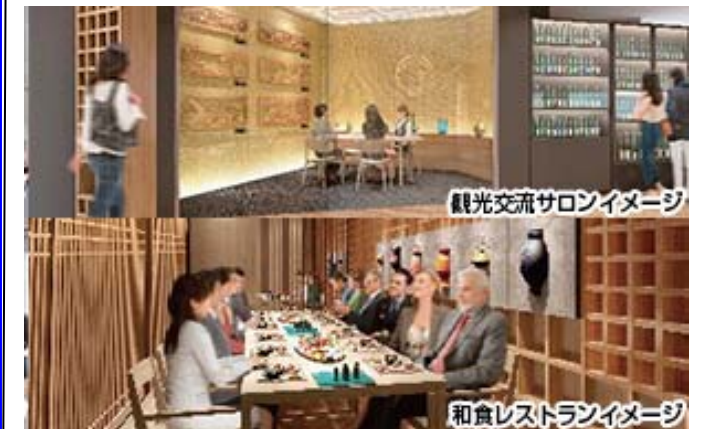
観光交流サロンイメージ