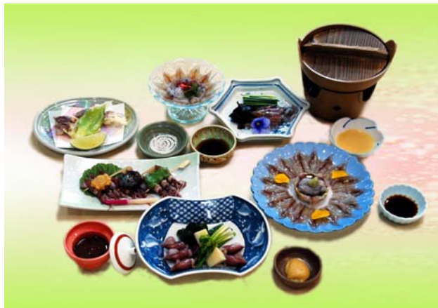
写真は6200円のイメージです、コースは予約制となっております。

雪プラン6200円 月プラン7200円 花プラン8200円 (税金8%、サービス料10%が含まれております)