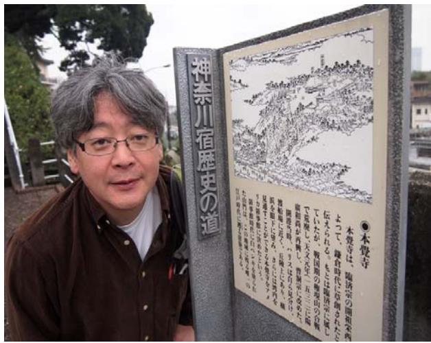
写真は神奈川の本覚寺を訪れた時。初代の米国領事館があり、ハリスが執務した。