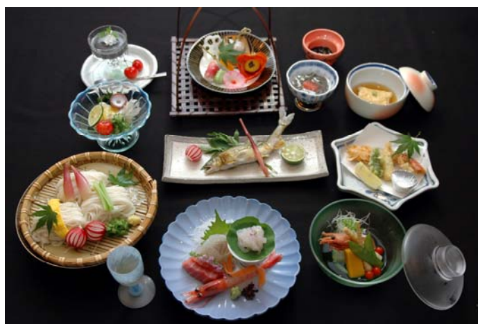
写真は7200円のイメージです、コースは予約制となっております。

和会席 お献立 先付け シロエビ塩麴和 お造り 平目昆布締 才巻エビ 梅貝 煮物 白ダツ胡麻クリーム 焼物 鮎塩焼き 凌ぎ 鱒寿司 酒肴 鯛魚麵 揚げ物 白エビ揚揚 酔の物 烏賊炙り 食事 氷見うどん 水菓子 こちらは月プランの例となっております。なお、仕入れの都合により内容が変わります。詳しくはご利用の際お気軽に