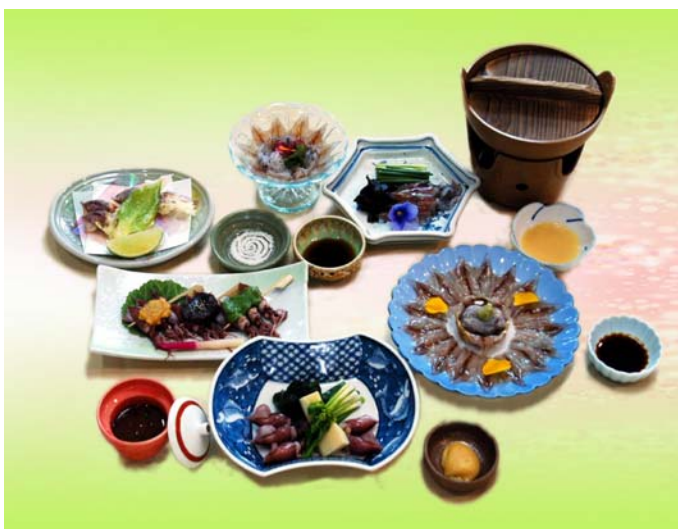
写真は7200円のイメージです、コースは予約制となっております。

雪プラン6200円 月プラン7200円 花プラン8200円 (税金8%、サービス料10%が含まれております)