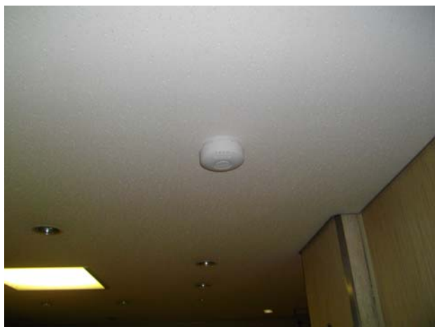
天井に付けられた機器

これにより、スマートフォンやタブレット端末、パソコンなどネット環境が大幅に改善され、外国人の方はもちろん、多くのお客様から、大変ご好評を得ております。