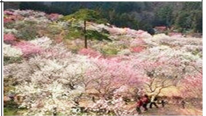
写真は青梅市吉野梅郷梅の公園